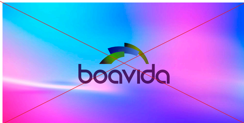
Não multiplicar cores do logo com o fundo